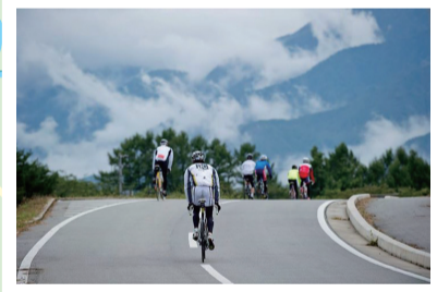
▲線路を越えれば絶景が広がる